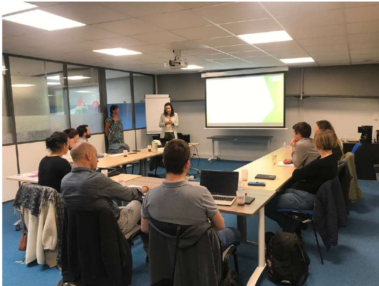
Présentation des différents profils neuroatypiques